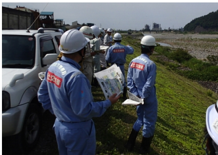
●重要水防箇所の確認 （糸魚川市西中地先）