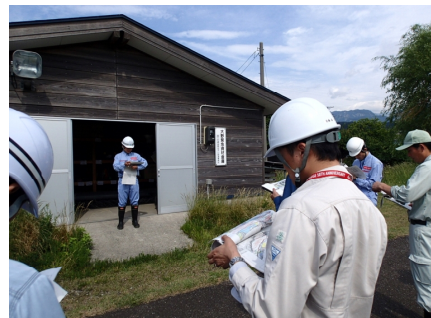
●緊急資材倉庫の確認 （糸魚川市大野地先）