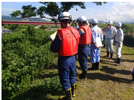
●県区間重要水防箇所の確認 （矢代川岡崎新田地先）