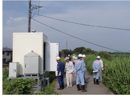
●水位観測所の確認 （保倉川佐内水位観測所）