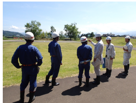
●水防拠点機能の確認 （妙高市月岡防災ステーション）