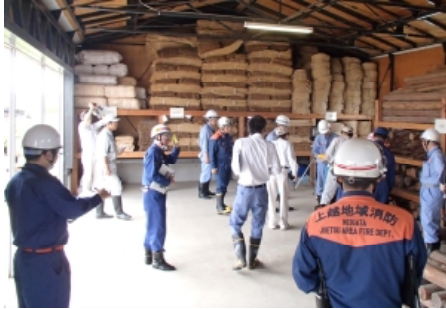
●水防倉庫の資材確認 （上越市下箱井地先）