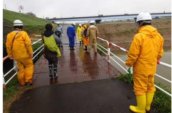
点検状況写真(4月21日:関川)