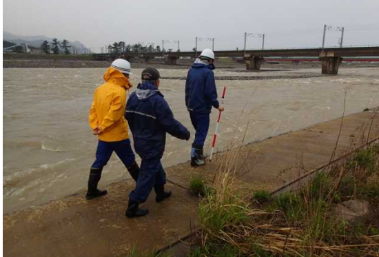
点検状況写真(4月20日:姫川)