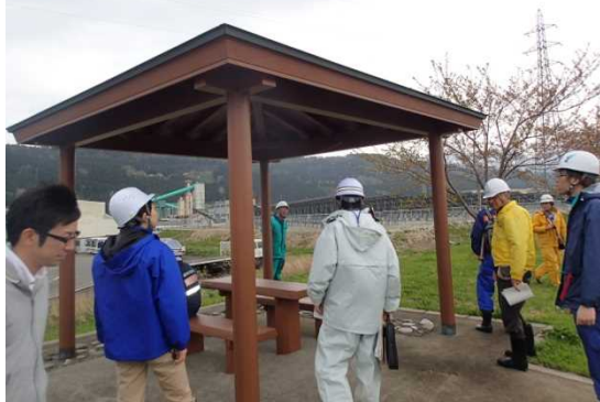
点検状況写真(4月20日:姫川)