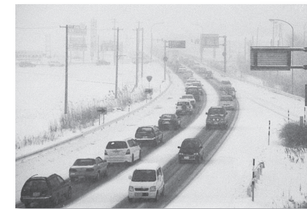
降雪による交通渋滞