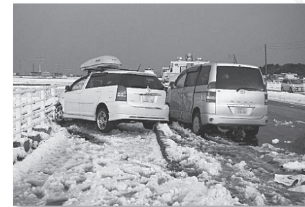
スリップによる多重事故

冬用タイヤへの交換など、車の冬支度がまだお済みでない方は、早めに冬の準備をお願いいたします。特に山間部へお出かけの際には、チェーンを携帯するなど冬の準備を万全にしてお出かけ下さい。