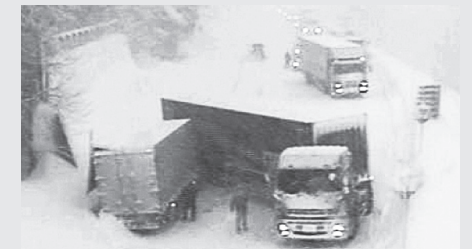
登坂不能車両に関連する事故

急な坂道を通行する際は、気象状況や路面状況に応じて早めに、確実に、ダブルチェーン装着をお願いします。