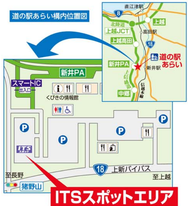
道の駅あらい構内位置図