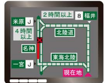
ITSスポット対応カーナビでの表示例