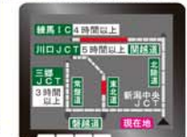
カーナビでの表示例