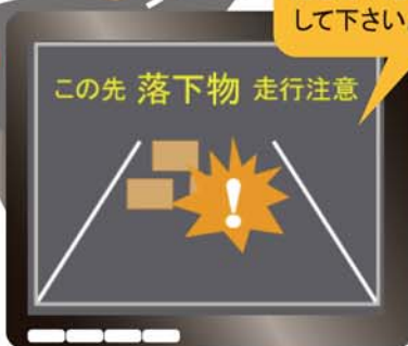
ITSスポット対応カーナビでの表示例