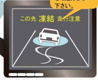
ITSスポット対応カーナビでの表示例

(音声) この先、路面が 凍結しています。 スリップに注意 して走行して 下さい。