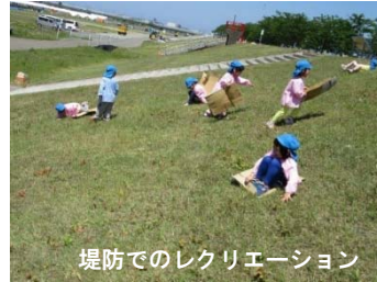
堤防でのレクリエーション