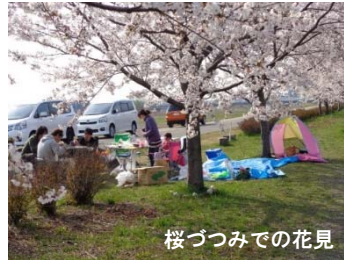
桜づつみでの花見