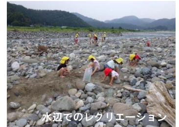
水辺でのレクリエーション