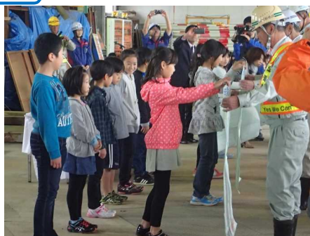
小学生から業者さんへの激励