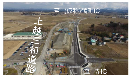
【工事の実施状況】 門田新田付近

○このうち、寺IC～(仮称)鶴町IC間(延長3.0km)は、平成30年度の暫定2車線開通を目指して改良工事、橋梁工事を推進しています。