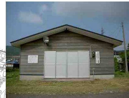
大野緊急資材倉庫