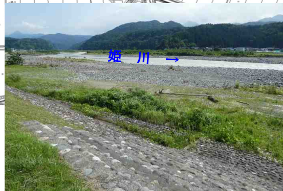
姫川右岸堤防から調査地点を望む