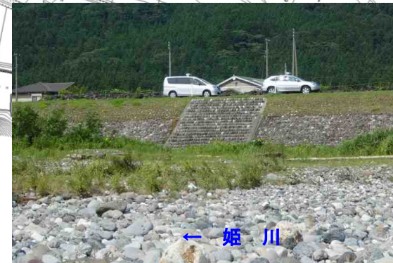
姫川右岸堤防の昇降階段