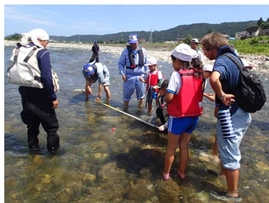
過去の姫川水生生物調査の実施状況(糸魚川市大野地先)