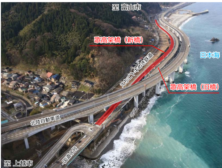
歌高架橋周辺状況(平成29年3月撮影)