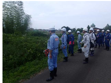
水防拠点機能の確認 （妙高市月岡防災ステーション）