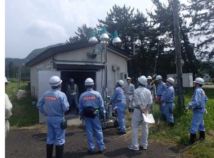
緊急資材倉庫の確認 （糸魚川市寺島地先）