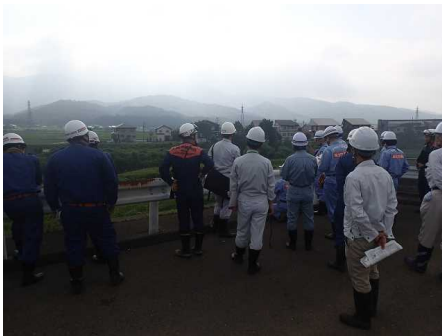
県区間重要水防箇所の確認 （矢代川岡崎新田地先）