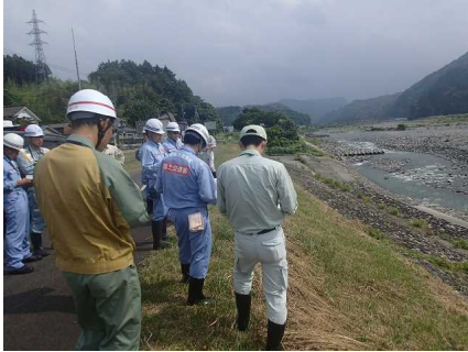
重要水防箇所の確認 （糸魚川市大野地先）