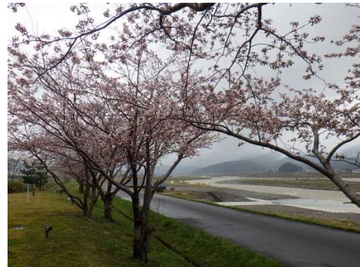
糸魚川市大野(姫川右岸)の桜堤