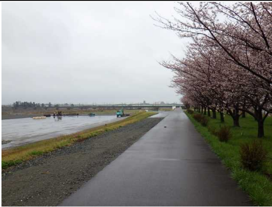
糸魚川市寺島(姫川右岸)の桜堤

姫川右岸の糸魚川市寺島地先と大野地先の桜堤の桜が見頃を迎えています。桜堤の前の河川敷では糸魚川大火の瓦礫処理の仮置きをしていますが、撤去作業も完了の目処が立ってきました。今週には満開になると思われますので、姫川の桜堤でのウォーキングやハイキングなどに是非、ご家族などで姫川を訪れてみてください。