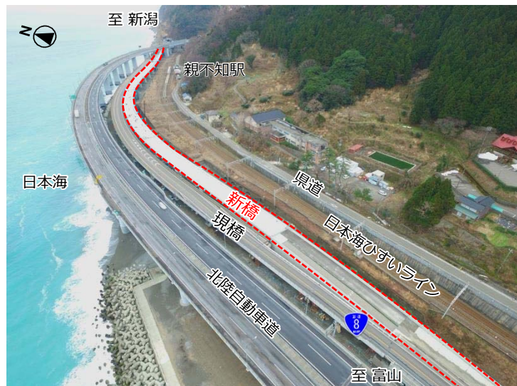
歌高架橋周辺状況(平成29年2月撮影)