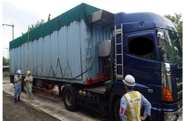
[過去の取締り状況: 国道18号]

道路を適正に利用することは、交通安全はもとより道路の老朽化対策としても重要であり、事業者には法令遵守の意識を高めていただくため、定期的に指導取締りを実施しています。