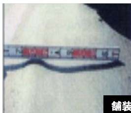
舗装のわだち掘れ