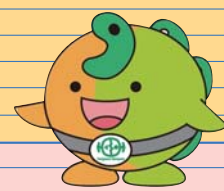
糸魚川ジオパーク キャラクター ジオまる

10:30~11:00頃 避難訓練のため、 糸魚川市及び近隣地区の 携帯電話で緊急速報 「エアメール」が鳴ります あらかじめご了承ください