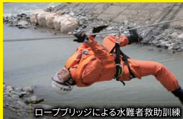
ロープブリッジによる水難者救助訓練

平成18年度 関川・姫川連合水防演習の様子 ※訓練内容は、今後変更する場合があります