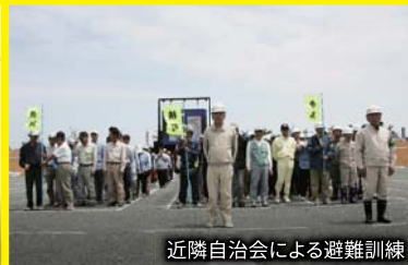
近隣自治会による避難訓練