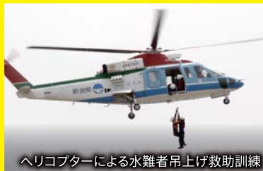
ヘリコプターによる水難者吊上げ救助訓練