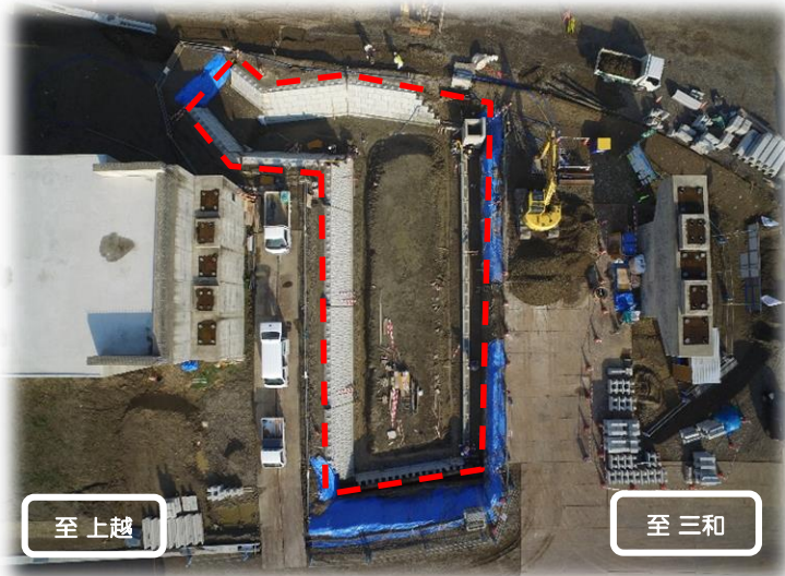
2号調整池 進捗状況