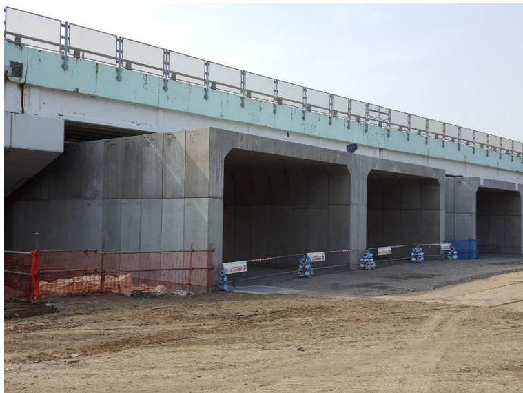
ボックス完了海側より望む

工 期: H29年8月22日～H30年10月31日(進捗率 100.0%) 5月31日現在