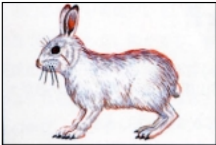
種名 トウホクノウサギ（ノウサギ、ヤマウサギ、オサギ）

背中は茶色がかった灰色で、お腹は白っぽい灰色です。人家のまわりの下水道や河川敷、畑地の広い範囲でみられます。水辺に近いところを好み、なんでも食べます。北陸自動車道の関川橋と今池橋あたりで確認されました。ほぼ全域に分布しています。