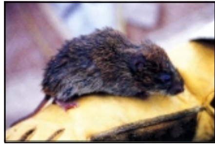
種名 ホンドハタネズミ（ハタネズミ）

明治時代に、アメリカから食糧としてもってこられた種類で、日本中に広がりました。体長は約20cmで、6～7月頃に、プォー、プォーと大きな声で鳴きます。新潟県内では、粟島をのぞく、いろんなところの池や用水路で見られます。関川のほぼ全域で、見られます。おもに、池のような、水がうごかないところで産卵していますが、関川本川のよども、産卵に利用しているようです。