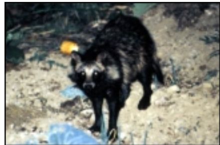
種名 ホンドタヌキ（タヌキ、ムジナ、マメダヌキ、タノキ）

夏は茶色ですが、冬には白くなります。平地から高山までの森林や、そのまわりで見られます。河口のあたりをのぞいて、関川の全域で見られます。なかでも、春日山橋から上流にたくさんいます。冬は、雪上に、たくさん足の跡がみられます。