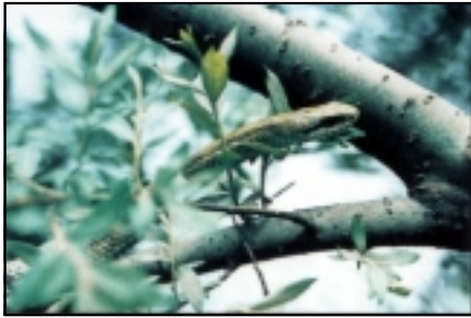
種名 アオダイショウ（サトメグリ、ムラクル）

低地から高山帯まで広く分布しています。背中茶色、お腹は白色で、畑や河川敷の草地に見られ、草やサツマイモ、ニンジンをよく食べます。北城の送水管のはけ口で、死体が見つかりました。河川敷の草地にすみ、関川のほぼ全域にすんでいます。