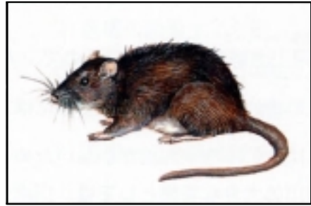
種名 ニホンドブネズミ（ドブネズミ）

緑色に近い灰色をしていて、はっきりしないたてじまがあります。小さな乳類や、小鳥類をつかまえて食べます。林や畑、人家のまわりでよく見られます。中々村新田と木田の送水管のはけ口や、大瀬川が合流するあたりや、上越大橋で見つかりました。なかでも、上越大橋のあたりでは、よく見られます。