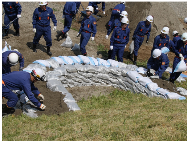
●月の輪工－土のう据付