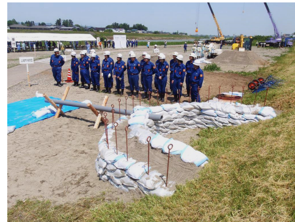
●月の輪工－土のう据付完了