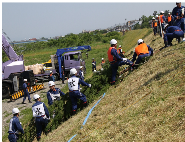
●木流し工－流水作用を演じる訓練者