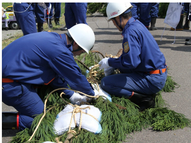
●木流し工－木への土のう据付