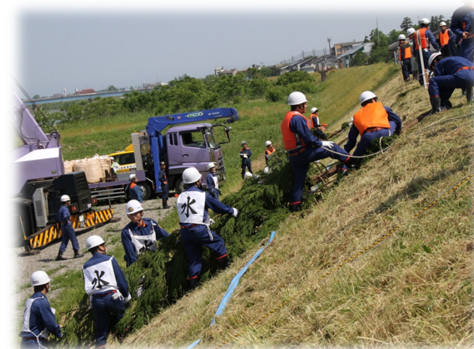
●消防団による木流し工