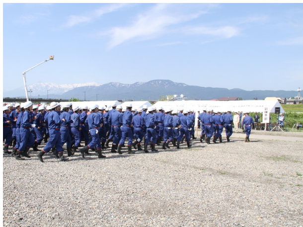
●訓練参加団体入場