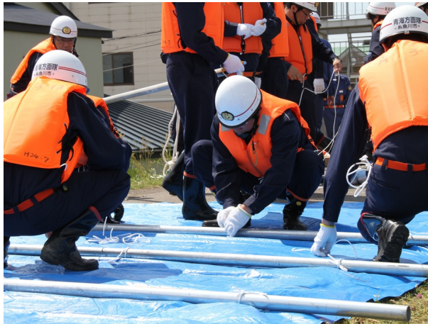
●シート張り工－シートへの単管取付け