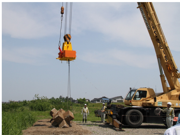
●大型ブロック投入工