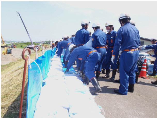
●改良積み土のう工－シート・土のう据付