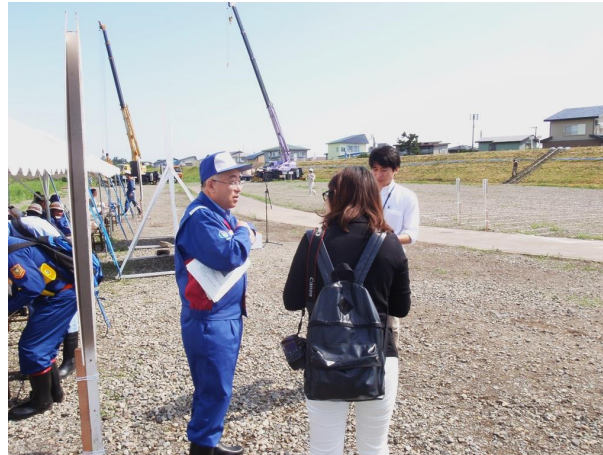
●メディアによる取材状況