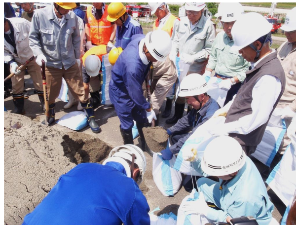
●市民積み土のう工－土のう製作