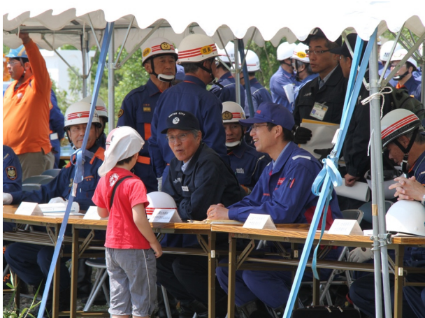
●本部席の上越市長と高田河川国道事務所長