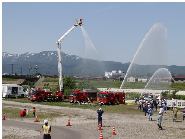
●排水ポンプ車と消防車による協同放水訓練