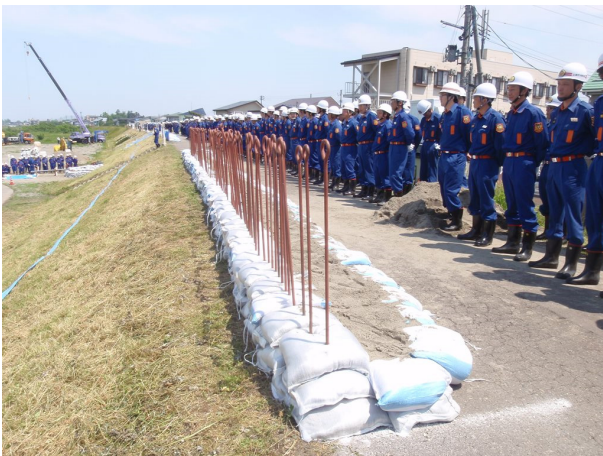
●積み土のう工－訓練完了