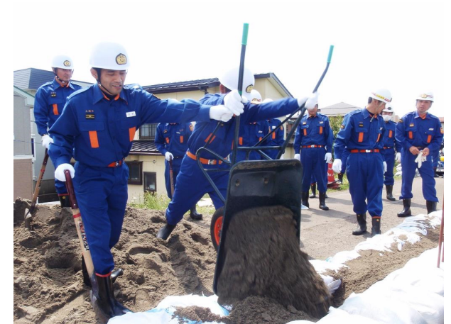
●積み土のう工－土のう据付