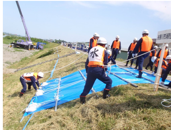
●シート張り工－堤防法面への配置