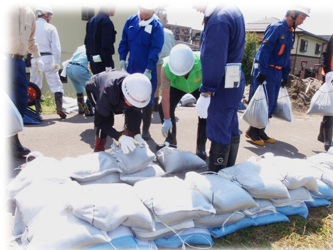
●上越市民による積み土のう工