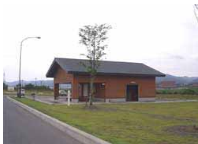
水防倉庫併設のトイレ