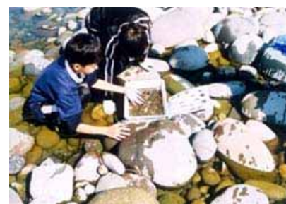
「川辺の学習」の様子