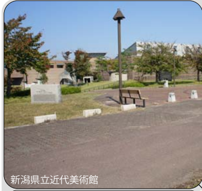
新潟県立近代美術館

長岡大橋～長生橋付近で土木構造物を見ることができます。また、この付近は公園があったりと自然豊かな空間です。 あなたも散歩してみませんか？