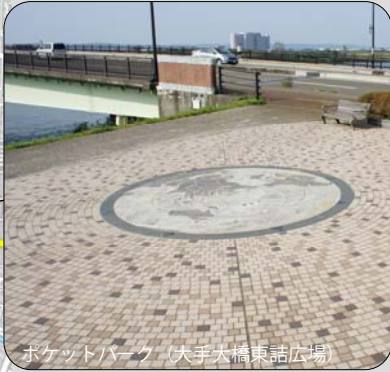
ポケットパーク（大手大橋東詰広場）