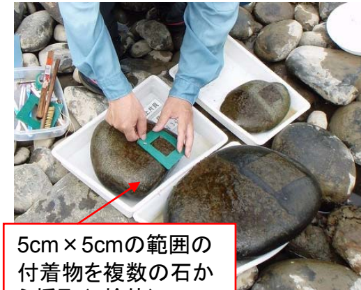
5cm × 5cmの範囲の付着物を複数の石から採取(5検体)

アユの餌条件として、強熱減量では、信濃川、魚野川ともに同程度であったが、クロロフィルa量では魚野川の方が多かった。