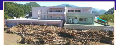
平成28年台風10号により、岩手県の要配慮者利用施設では利用者9名の全員が死亡。