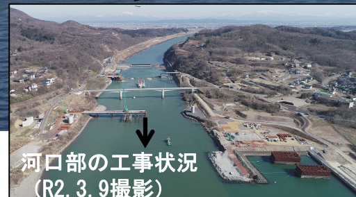
河口部の工事状況(R2.3.9撮影)