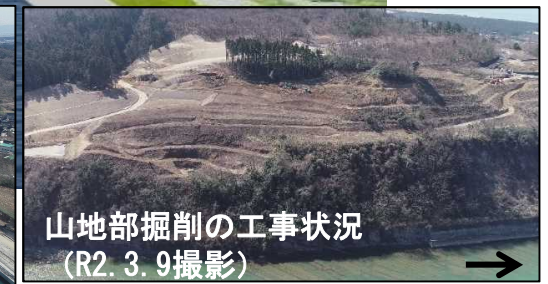
山地部掘削の工事状況(R2.3.9撮影)