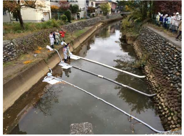
オイルフェンス設置方法の説明・実技訓練