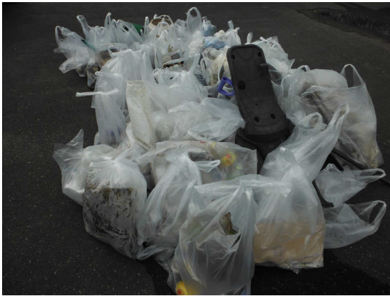
【昨年のゴミ集積状況】