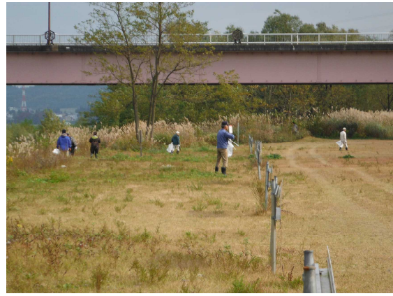
【みんなで信濃川をきれいにしよう！】