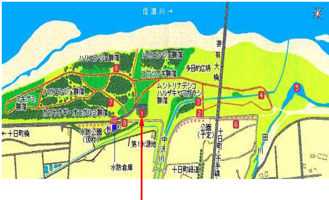
つまりっ子広場高水敷駐車場