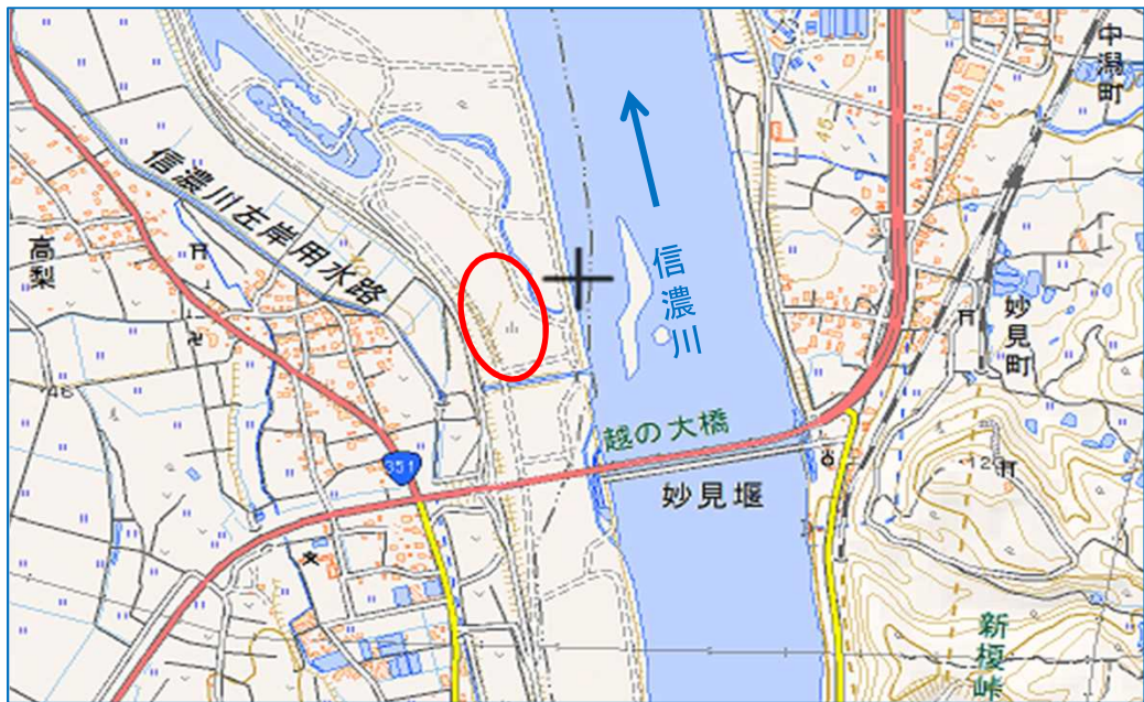
5月19日(木):十日町地域夜間水防訓練