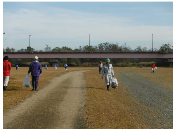
【みんなの手で信濃川をきれいに!】