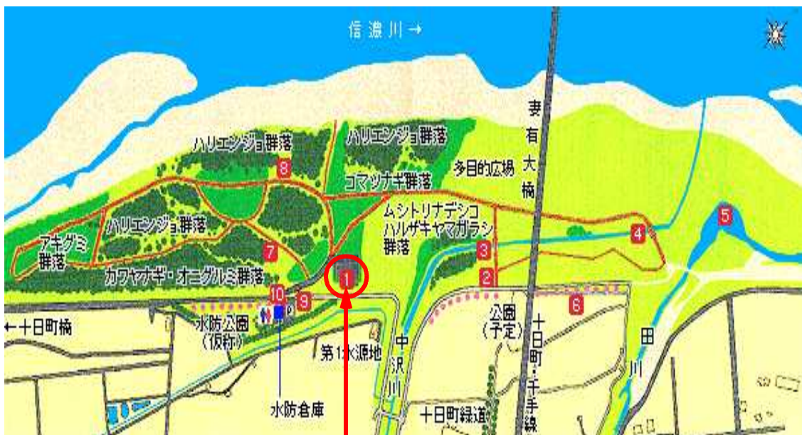
つまりっ子広場高水敷駐車場