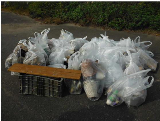
【昨年のゴミ集積状況】