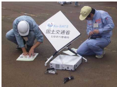
平成26年度実施の様子