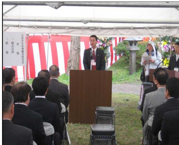
昨年度の実施状況

現在は、その後の信濃川補修工事及び大河津分水完工後の維持管理工事等を行う上で殉職された16名（昭和40年度が最終）の方を含め、100名の方のお名前が石碑に刻印されています。