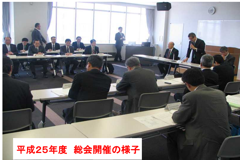
平成25年度 総会開催の様子

議事概要 : ①平成25年度 事業報告 ②平成26年度 事業計画 ③重要水防箇所について ④その他