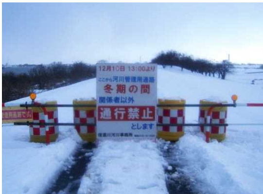
宮村橋付近（長岡市中条地先） 昨年の看板設置状況