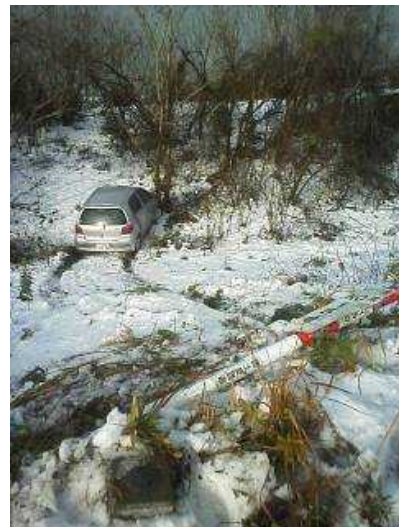
スリップによる転落事故の状況