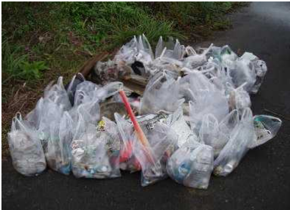
【昨年のゴミ集積状況】