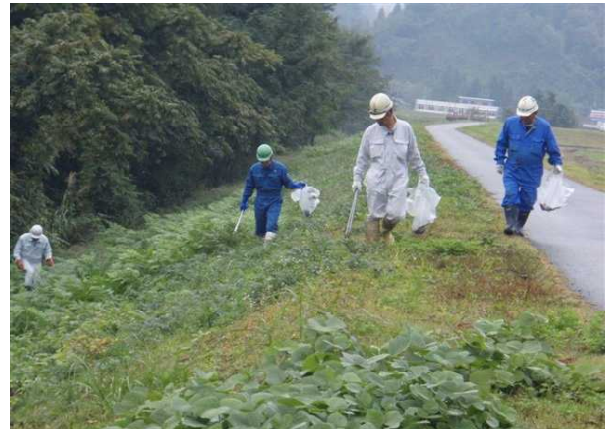
【みんなの手で信濃川をきれいに！】