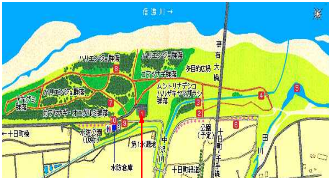
つまりっ子広場高水敷駐車場