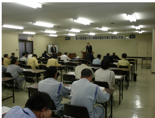
～昨年度建設労働災害防止大会の様子～