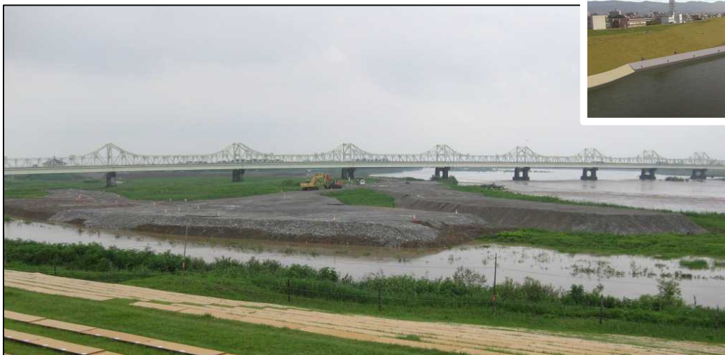
仮設準備中の工事現場の状況(H25.7.30)