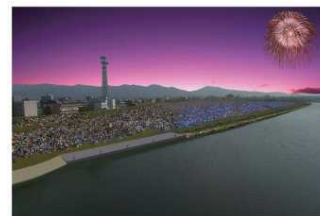
高い河川敷が利用されるイメージ(長生橋下流)