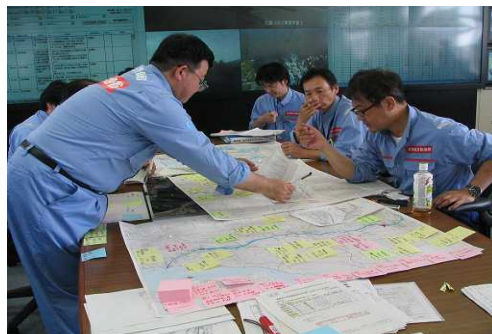
平成24年度 演習実施の様子

そ の 他 : カメラ撮影等は情報伝達演習に影響の出ない範囲でお願いいたします。