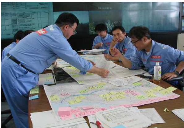
平成24年度 演習実施の様子

演習内容 : 想定した洪水において、次の内容で机上による情報伝達演習を関係機関の協力を得ておこないます。 ・ 防災対応に必要な情報収集(出水状況、施設の被災状況、沿川の状況把握など) ・ 関係機関への情報伝達(洪水予測や水防警報など防災上重要情報の迅速な伝達) ・ 状況に応じた緊急復旧等の迅速な実施(災害対応の検討~実施)