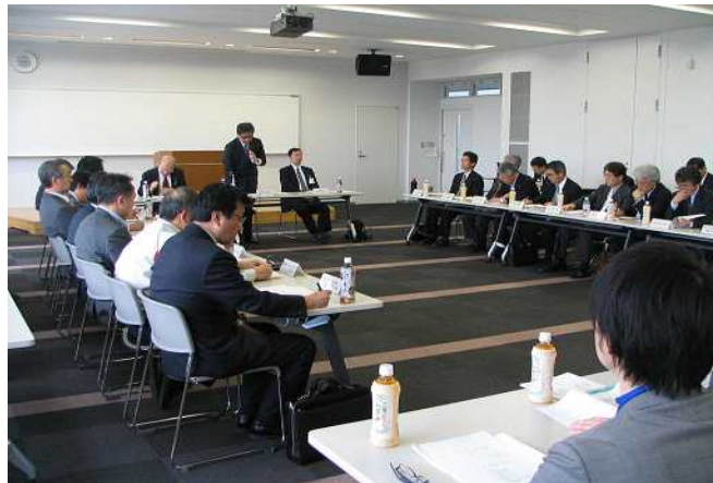
平成24年度 総会開催の様子