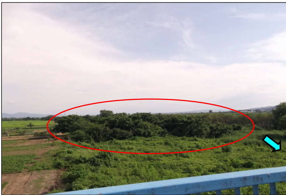
伐採予定箇所の状況 : 長岡市並木新田地先(信濃川 与板橋上流右岸)

そこで、薪などとして伐採木を利用したいとの希望が多いことに着目し、経費を節減し伐採促進を図る試みとして伐採希望者を一般公募し、その伐木を無償で持ち帰ってもらう方式を試験的に実施することとしました。