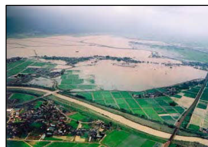
平成16年7月新潟・福島豪雨 長岡市新組地区浸水状況(H16.7.14撮影)

洪水避難地図とは、堤防が決壊したときの浸水範囲と浸水の深さ、その時の避難所などの避難情報がわかる地図を指し、「洪水ハザードマップ」ともいいます。