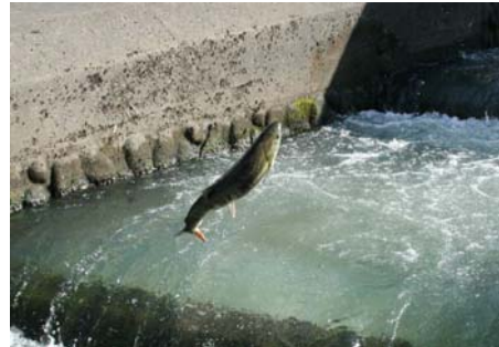
魚道を遡上するサケ（H21 撮影）