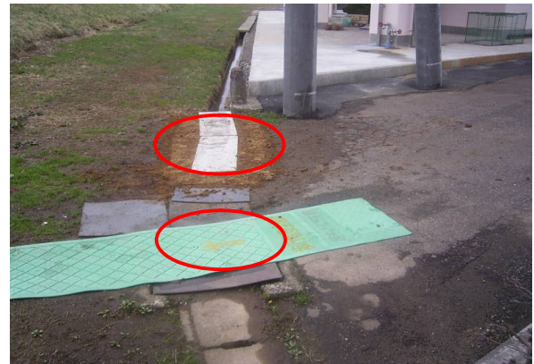
堤防法尻水路(長岡市信濃地先)において破損していた蓋の 取替えと不安定な鉄板蓋の対策としてラバーマットを設置