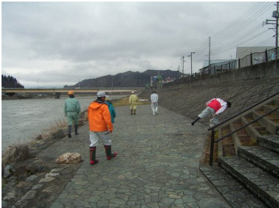
親水護岸(魚沼市小出地先)付近での点検状況 (魚沼市と合同で実施)

今回の点検で危険性が確認されなかった施設やその周辺についても、天候その他により現地の状況は日々変わります。河川敷等を利用の際は、利用者自らが安全を確認の上、ご利用頂きますようお願いいたします。