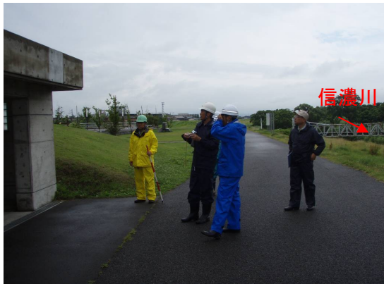
長岡水辺プラザ(長岡市水道町地先)での点検状況(長岡市と合同で実施)

国土交通省では、昭和49年から毎年7月を「河川愛護月間」と定め河川愛護運動を実施していますが、近年多発する水難事故を受け今年度より新たに7月1日から同7日を「河川水難事故防止週間」と定め、水難事故防止に向けた各種啓発活動に取り組んでいます。