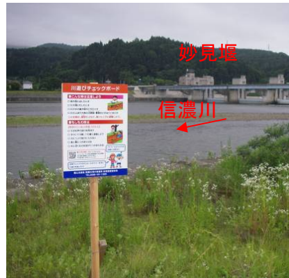
妙見堰下流(小千谷市高梨地先)に設置した「川遊びチェックボード」