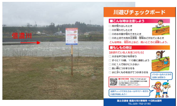
水辺の学校(十日町市下島地先)付近に 設置した安全ロープ・看: