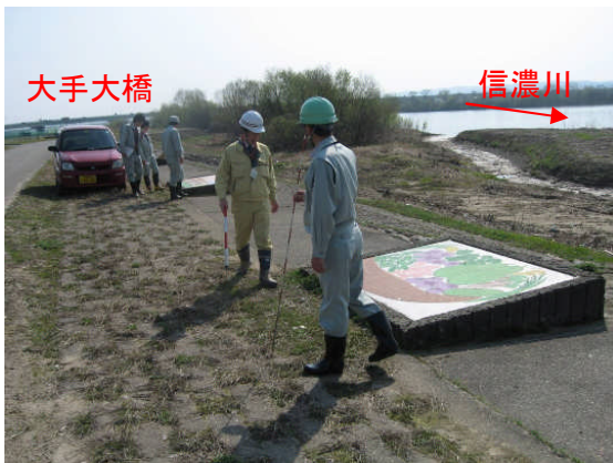
親水護岸(長岡市中島地先)付近での点検状況 (長岡市と合同で実施)

今回の点検で危険性が確認されなかった施設やその周辺についても、天候その他により現地の状況は日々変わります。河川敷等を利用の際には、利用者自らが安全を確認の上、ご利用頂きますようお願いいたします。