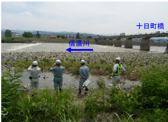
信濃川(十日町市小泉地先)付近での点検状況

今回の点検で危険性が確認されなかった施設やその周辺についても、天候その他により現地の状況は日々変わります。河川敷等を利用の際には、利用者自らが安全を確認の上、ご利用頂きますようお願いいたします。