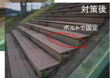
魚野川(魚沼市小出島地先)階段護岸補修状況