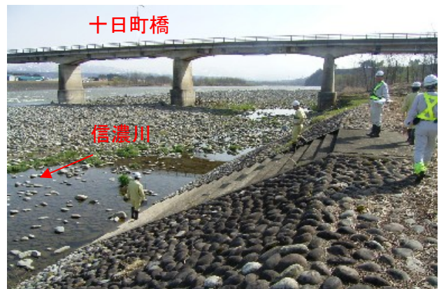
十日町橋(十日町市小泉地先)付近での点検状況