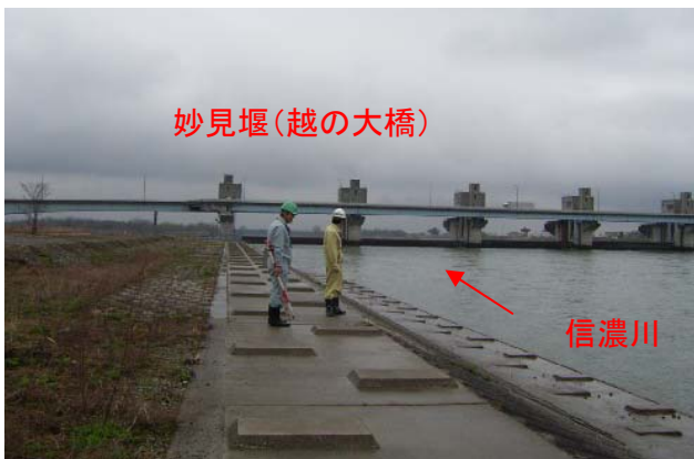
妙見堰(小千谷市三仏生地先)付近での点検状況

今回の点検で危険性が確認されなかった施設やその周辺についても、天候その他により現地の状況は日々変わります。河川敷等を利用の際は、利用者自らが安全を確認の上、ご利用頂きますようお願いいたします。