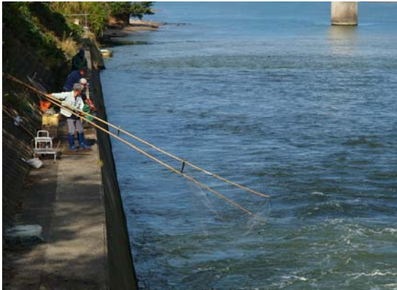
(社)北陸建設弘済会理事長賞 サケの季節 刈屋 寿