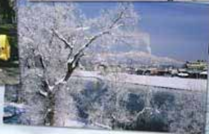
「優秀賞」美しい朝 伊藤誠平氏作品