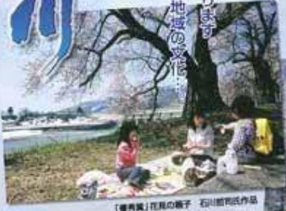
「優秀賞」花見の様子 石川智氏作品