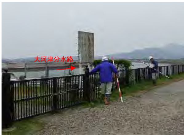
安全柵点検状況(燕市五千石 大河津分水路右岸)

今回の点検で危険性が確認されなかった施設やその周辺についても、天候その他により現地の状況は日々変わります。河川敷等を利用の際は、利用者自らが安全を確認の上、ご利用頂きますようお願いいたします。