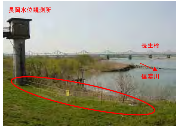
安全ロープ設置状況(長岡市信濃 信濃川右岸)